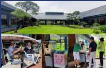
골프장, 리조트 Golf Resort