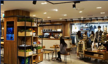
숍인숍 SHOP in SHOP